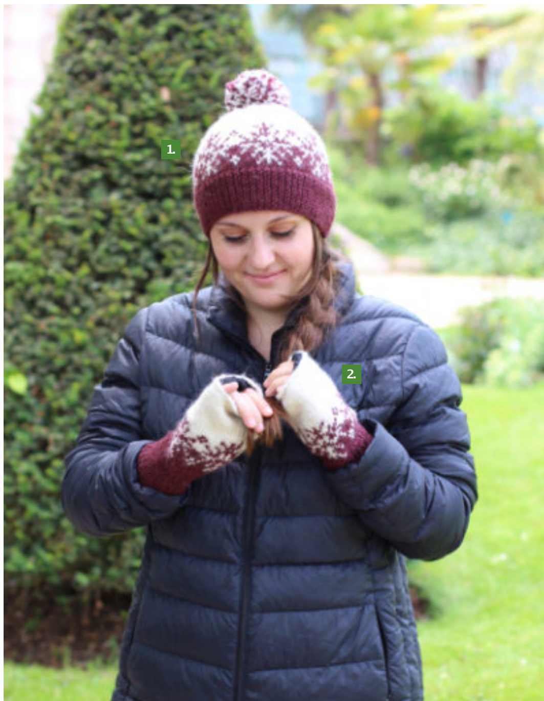
1. Bonnet en laine / ACP735 / 36,50€TTC 2. Mittaines en laine / ACP736 / 36,50€TTC